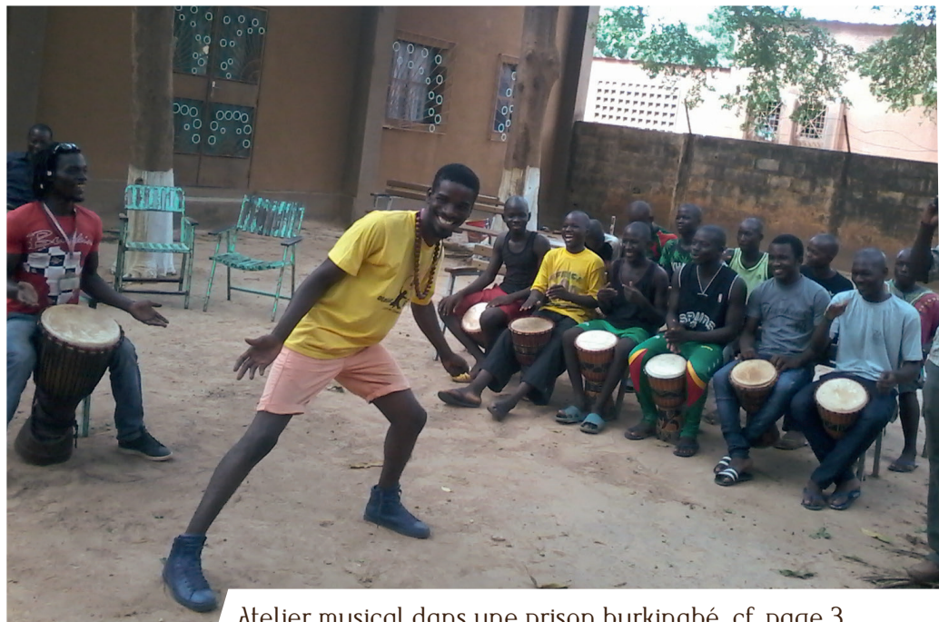
Atelier musical dans une prison burkinabé, cf. page 3

ans a montré sa ténacité. Sans lassitude, en permanence, il faut expliquer à ceux qui voudraient apporter de l'aide aux personnes détenues plus proches géographiquement qu'il n'y a pas de priorité ni de hiérarchie en matière de misère carcérale. Les projecteurs médiatiques, dans la plupart des cas, sont moins centrés sur la situation des personnes détenues en Afrique ; raison de plus pour tenter de leur apporter une aide qui leur fait cruellement défaut afin de satisfaire leurs besoins les plus élémentaires en matière de nourriture, d'hygiène et de soins. C'est pour répondre à ces exigences humanitaires que PRSF visite 83 prisons regroupant plus de 30 000 détenus. Les détenus africains font bien partie de ces populations oubliées. Avec ténacité, donateurs et visiteurs bénévoles continuent. Merci à eux de nous rappeler à cette solidarité.