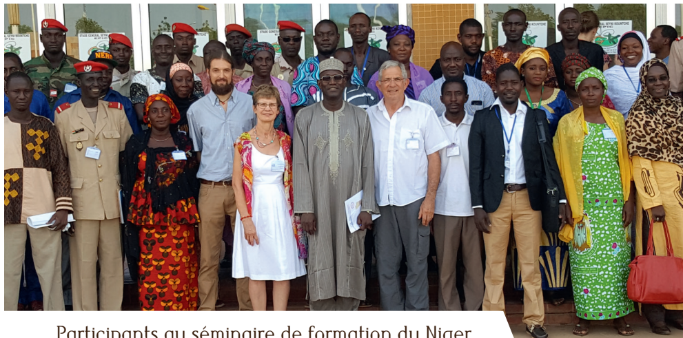
Participants au séminaire de formation du Niger